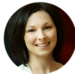
Pre. France St-Hilaire Ph. D. Directrice de la veille scientifique Global-Watch Directrice de l'Équipe sur les organisations en santé (ÉOS) Professeure agrégée, Département de management et gestion des ressources humaines, École de gestion Université de Sherbrooke