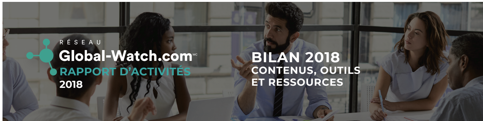
Plate-forme d'élaboration et de diffusion de contenus, Global-Watch ...