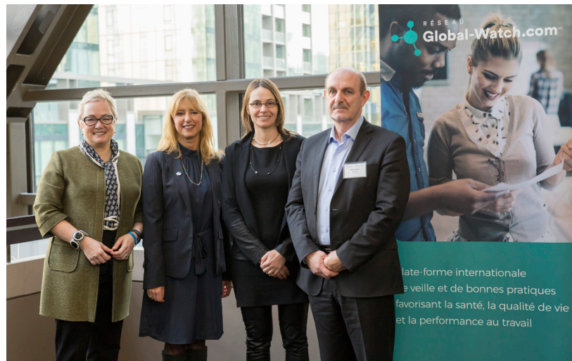
Plate-forme internationale de veille et de bonnes pratiques favorisant la santé, la qualité de vie et la performance au travail

Lancement canadien de Global-Watch lors de la Journée sur la santé psychologique en milieu de travail Les Affaires .